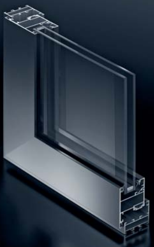
Ventana Schüco AWS 50.NI con apertura hacia el exterior Schüco Window AWS 50.NI outward-opening