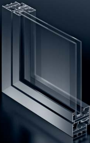
Ventana Schüco AWS 50.NI con apertura hacia el interior Schüco Window AWS 50.NI inward-opening